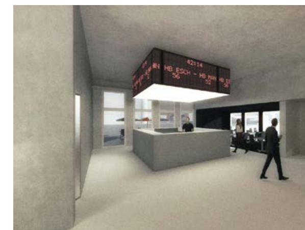
Simultationen: Bureau d'architecture 2001 (Esch-Alzette)