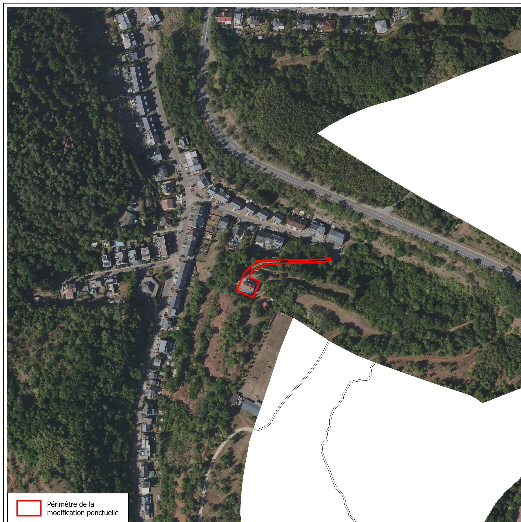
A: Image aérienne et délimitation de la modification ponctuelle